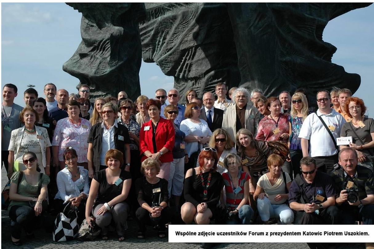
Wspólne zdjęcie uczestników Forum z prezydentem Katowic Piotrem Uzukiem.